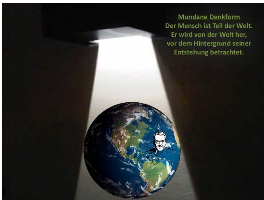
Abb. 5: Mundane Denkform, eigene Darstellung nach Welsch

Zwei Sichtweisen auf den Menschen scheinen – so Welsch - einander auf den ersten Blick zu widersprechen: Als homo mundanus wird der Mensch als Weltkongruenter von der Welt her erfasst,