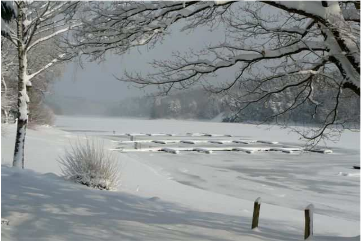
Europäische Akademie für biopsychosoziale Gesundheit, Beversee, Winter