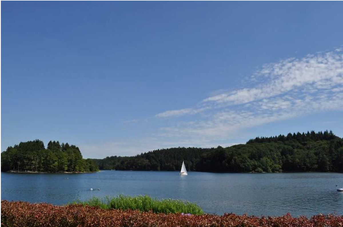
Europäische Akademie für biopsychosoziale Gesundheit, Beversee, Sommer