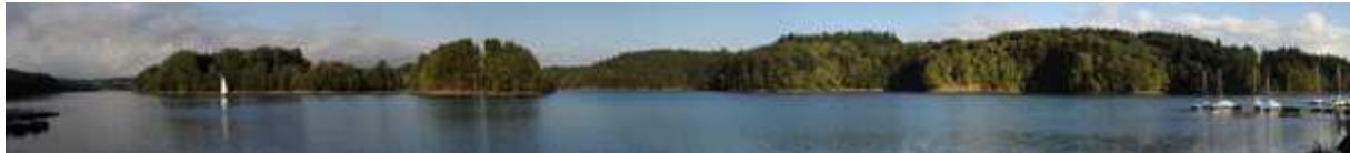
Blick vom Seeufer der EAG