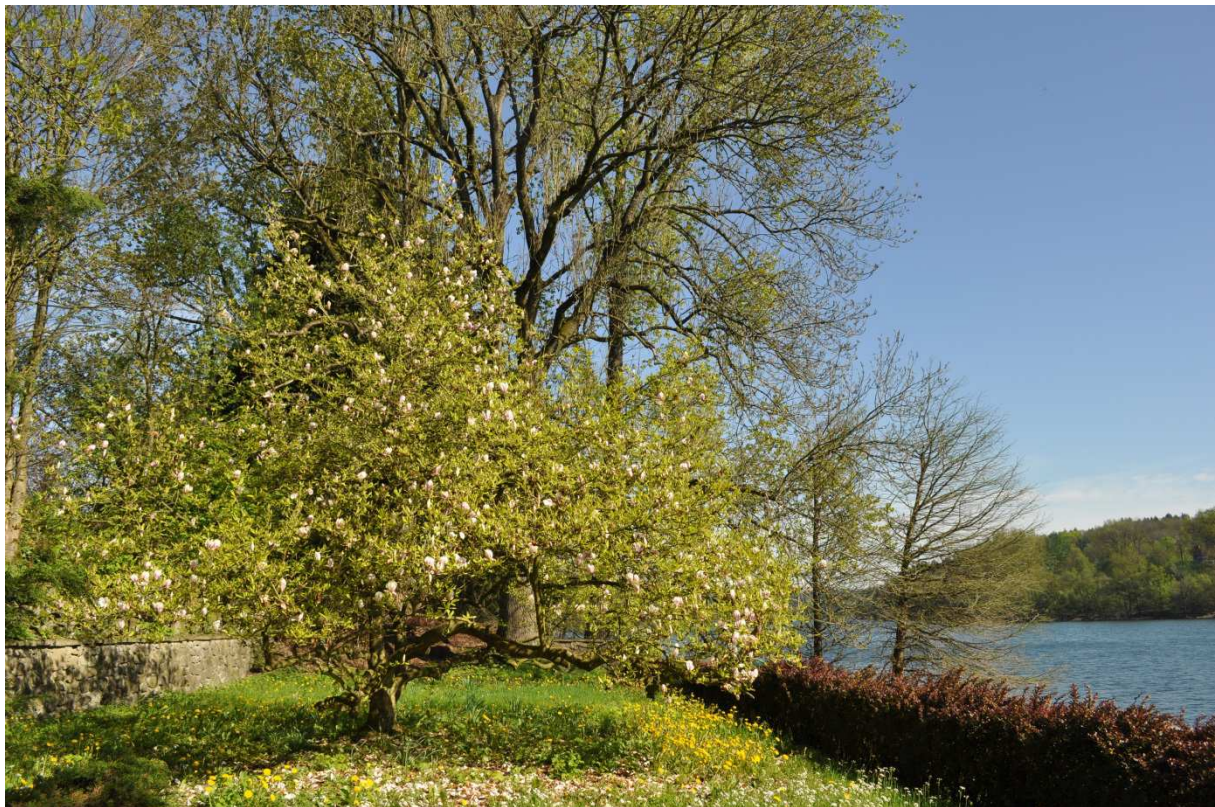
Frühling an der Europäischen Akademie für biopsychosoziale Gesundheit, Beversee, 2015

Grün kommt – wie auch das Wort Gras – von althochdeutsch gruonen , wachsen,