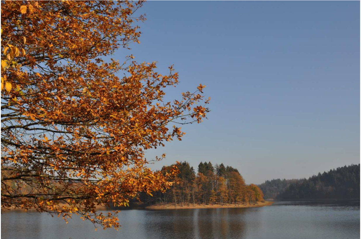
Europäische Akademie für biopsychosoziale Gesundheit, Beversee, Herbst