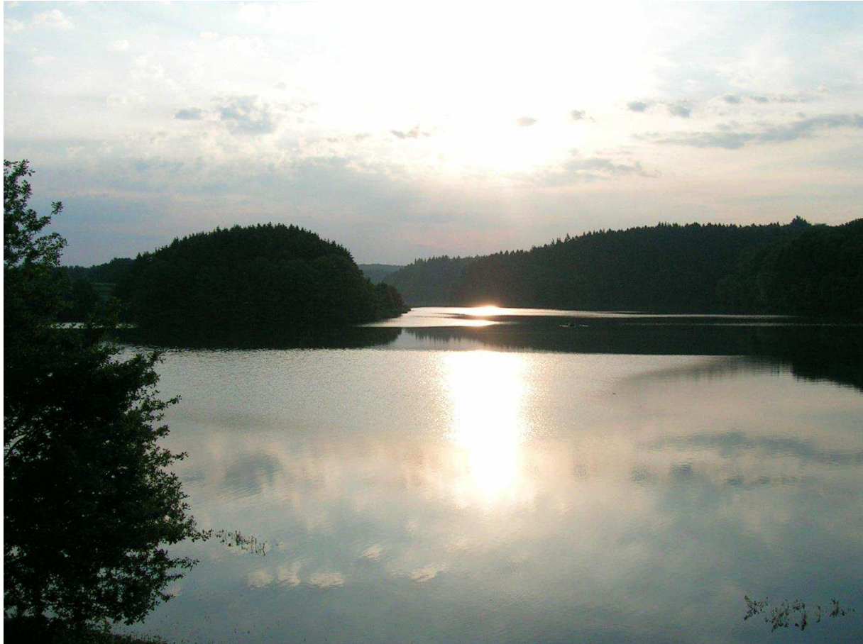
Blick vom Ufer der „Europäischen Akademie für biopsychosoziale Gesundheit“, Beversee