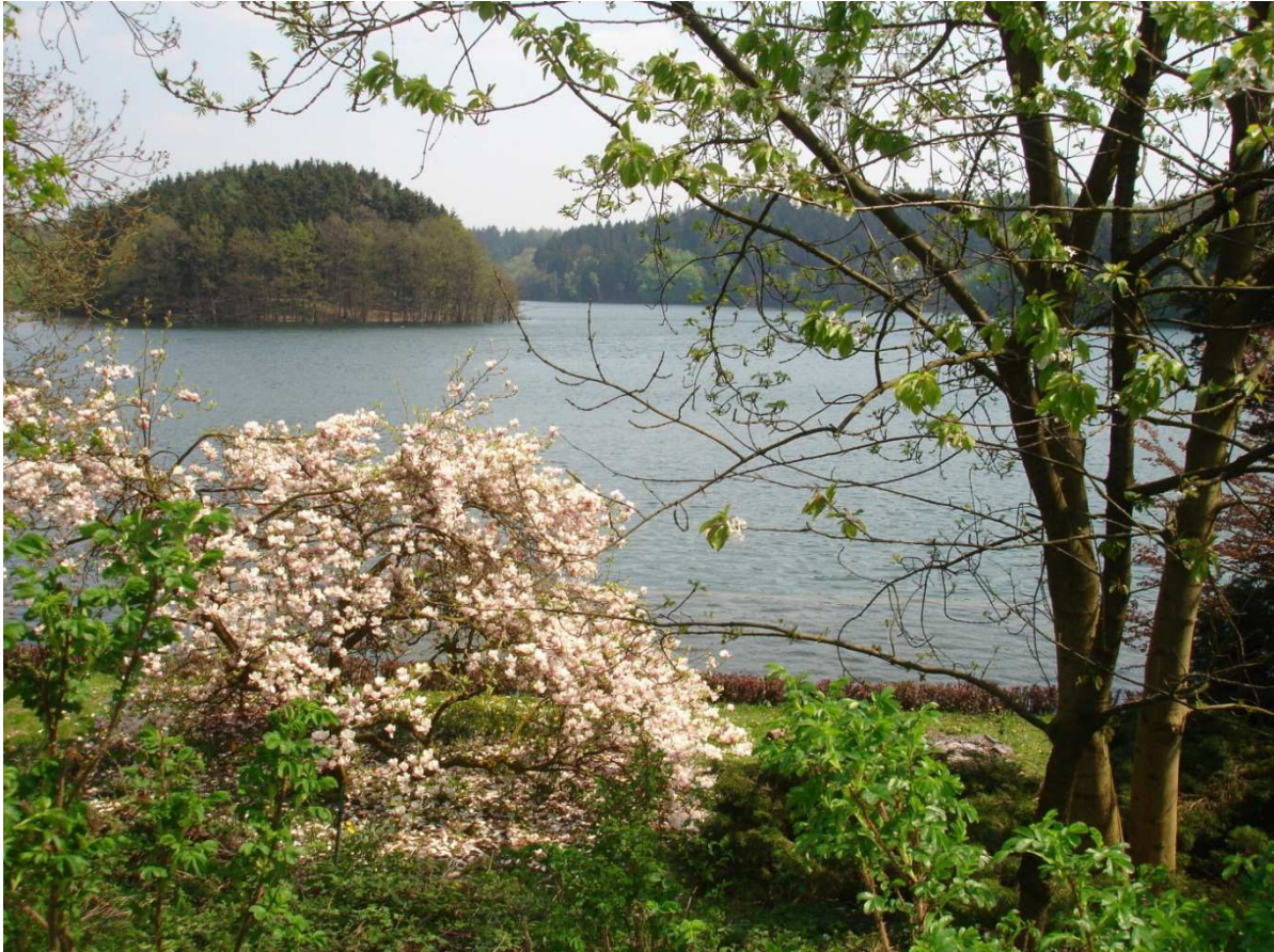
Europäische Akademie für biopsychosoziale Gesundheit, Beversee, Frühjahr.