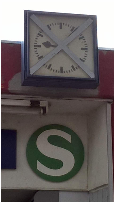
Abb. 3: Uhr am S-Bahnhof-Düsseldorf Eller-Süd