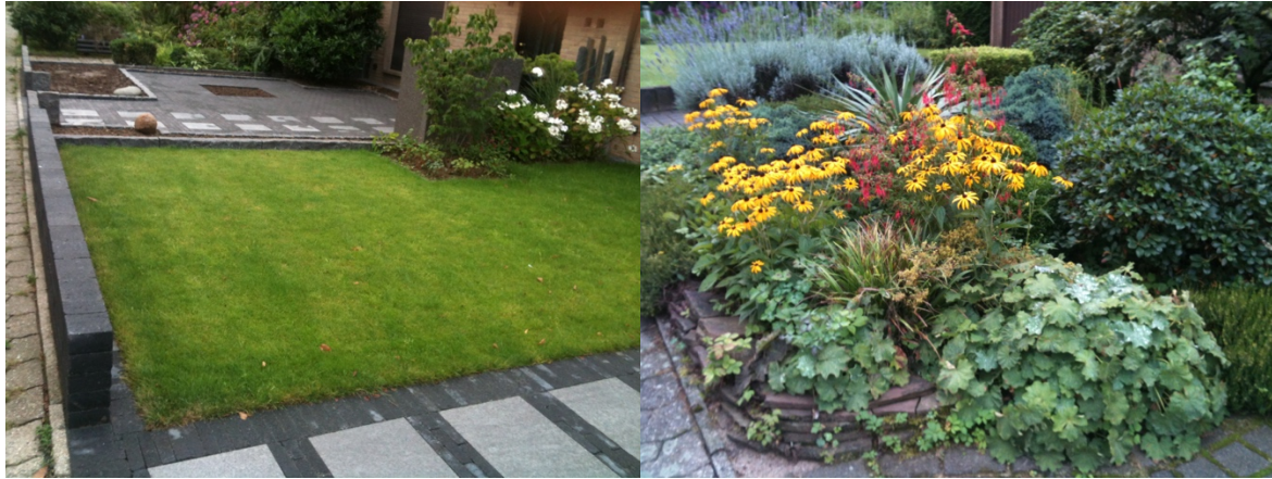
Abb. 9: Beispiele für die unterschiedlichen Möglichkeiten der Vorgartengestaltung in einem Wohngebiet. Es handelt sich um Nachbargrundstücke (eigene Aufnahmen)

Wer selber erfahren hat, was ihm gut tut, für den gewinnt genau das Wert. Denn diese positive Erfahrung ist im Leib gespeichert.