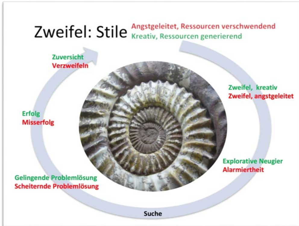
Abb. 7: Zweifel, eigene Darstellung nach Petzold

Gleichzeitig ist der Mensch Teil der Welt . Also werden sich seine devolutionären Praktiken gegen ihn richten, wenn er ihnen keinen Einhalt bietet, wenn er nicht das gesamte Lebendige schützt, sondern sich auf den vordergründigen Schutz des Menschenlebens (der Privilegierten) allein konzentriert.