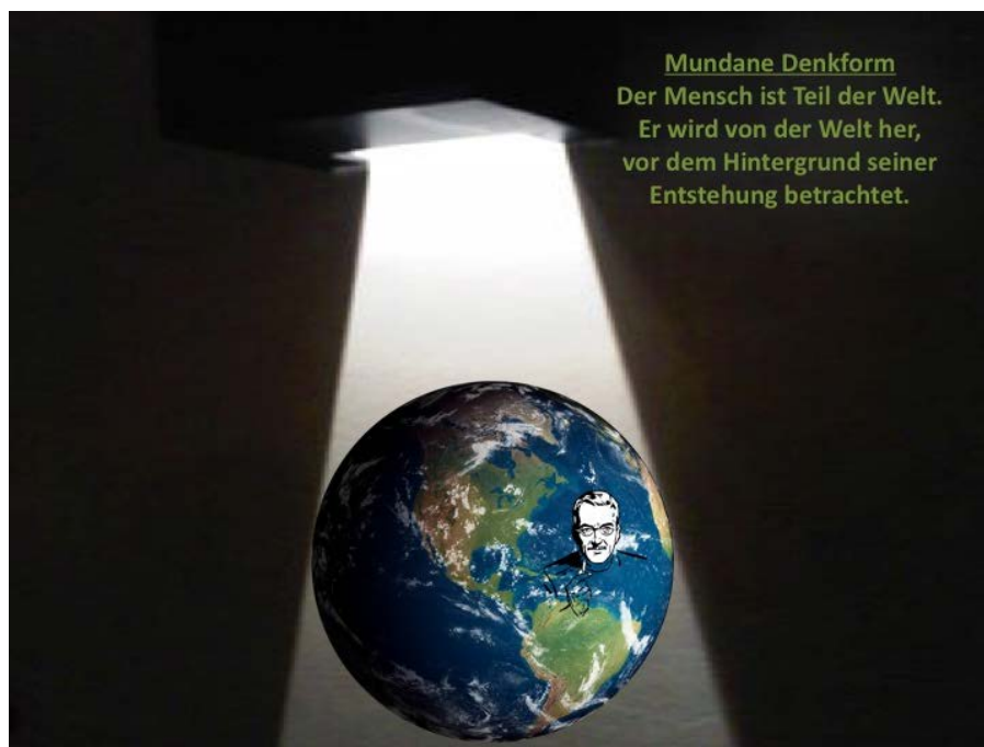
Abb. 5: Mundane Denkform, eigene Darstellung nach Welsch

Zwei Sichtweisen auf den Menschen scheinen – so Welsch - einander auf den ersten Blick zu widersprechen: Als homo mundanus wird der Mensch als Weltkongruenter von der Welt her erfasst,