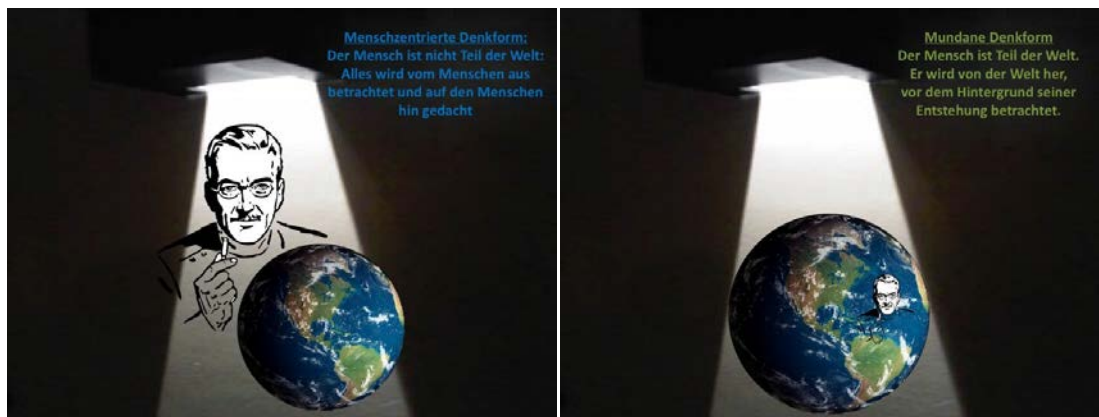
Abb. 1 Vergleich der anthropischen (links) und Abb. 2 der mundanen Sichtweise (rechts), eigene Darstellung, nach Welsch

Der Mensch ist - so argumentiert Welsch - in Korrespondenz mit den Bedingungen der Welt entstanden: Die Geschichte der Erde und des Alls ist die Geschichte, in die Menschen eingebunden sind. Die Geschichte des Planeten hat die Voraussetzungen geschaffen, die die Entstehung der Art ermöglichen. Diese Genesis gehört zur Geschichte der Menschheit, ohne die sie nicht gedacht werden kann. Zu seiner Argumentation im Einzelnen: