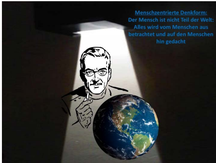
Abb. 3 Menschzentrierte Denkform, eigene Darstellung nach Welsch

Die anthropische Denkform geht jeweils vom Menschen aus. „Die Welt, die wir kennen, die Welt auf die wir uns beziehen, die Welt von der wir sprechen, ist grundsätzlich Menschenwelt“ 29 . Der Mensch gibt der Welt - so das anthropische Prinzip - Sinn. Er gibt der Welt aus seiner, der in seiner Weltfremdheit als einzig gültige Perspektive aufgefassten Sicht, Sinn.