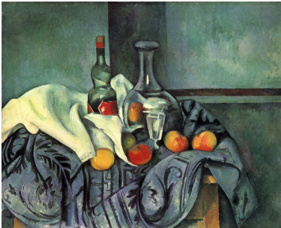
Abb. 4 Paul Cezanne, Stilleben, Pfefferminzflasche, Jahr: 1893-1895, Maße:65,7 x 82 cm, Technik: Öl auf Leinwand, Ort:Washington (D.C.), Museum: National Gallery of Art https://upload.wikimedia.org/wikipedia/commons/1/16/Paul_Cézanne_201.jpg (27.07.2016)

verschlossene, die „unmenschliche“ Seite der Dinge sind wir nicht aufmerksam und doch erfahren wir schattenhaft, dass es sie gibt. Es liegt in der Natur der Sache, dass für diesen Bereich der „schattenhaften Wahrnehmung nur schwer die passenden Worte zu finden sind, daher bietet sich möglicherweise eine Annäherung über die darstellende Kunst an: Merleau-Ponty hat 1945 einen Aufsatz mit dem Titel „Der Zweifel Cezannes“ veröffentlicht, in dem er Cezannes Malerei als eine beschreibt, die sich bemüht, ein vollständiges und originäres Echo der Dinge auf das Bild zu bringen. So sehen die Menschen die „unmenschliche“ Seite der Dinge, die jedem Ding inne ist. „Cezannes Malerei...enthüllt den Boden einer unmenschlichen Natur, auf dem der Mensch sich einrichtet.“ 73