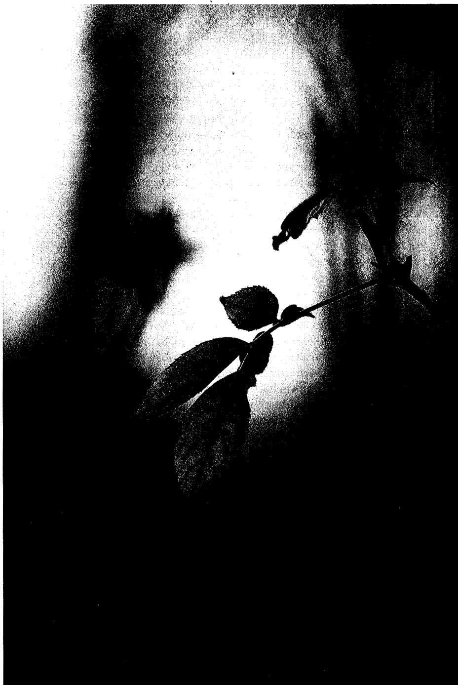
Abb. 1: Einsame Blätter