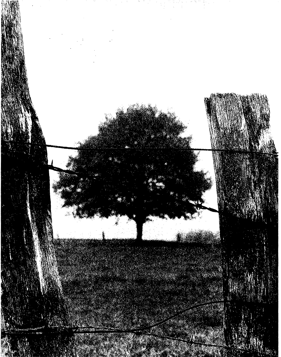
Abb. 5: Durchblick und Ausblick