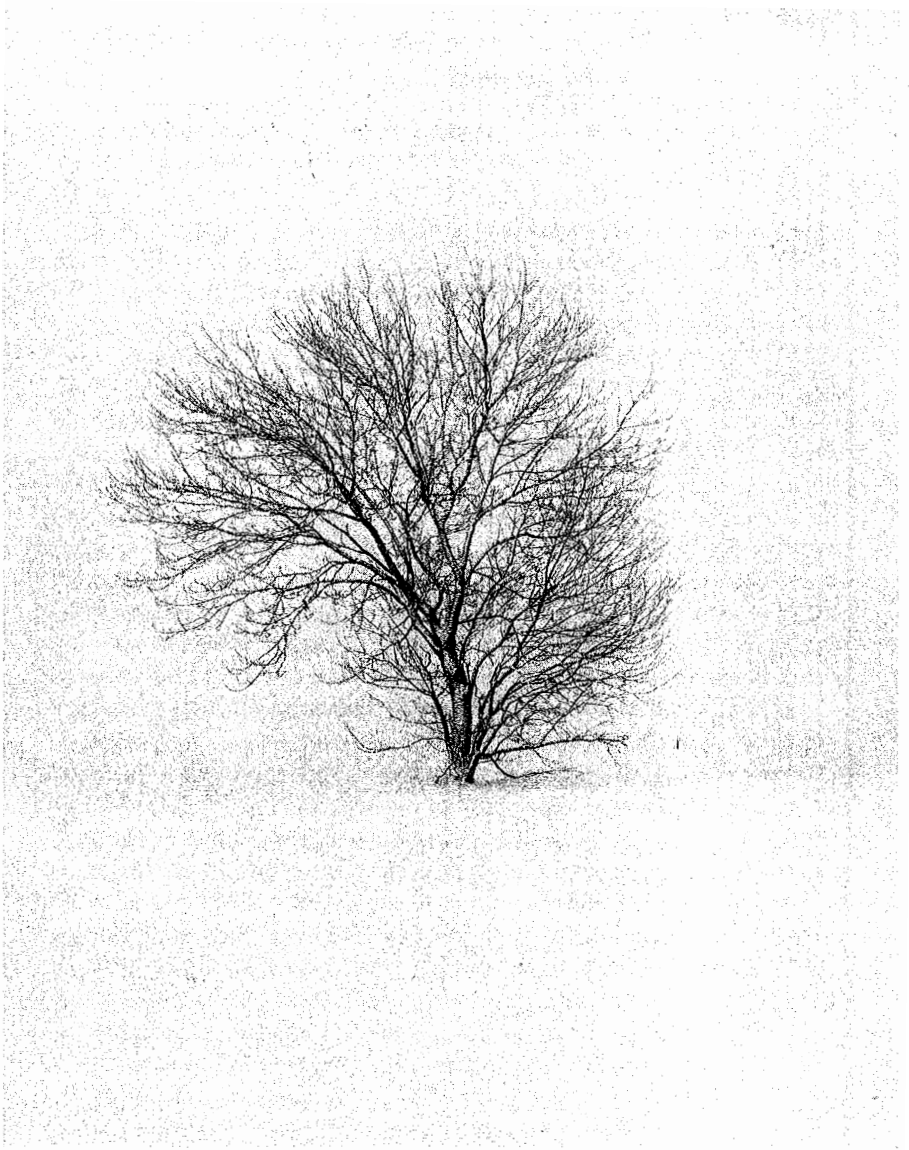
Abb. 6: Ich bin eine Ahnung.