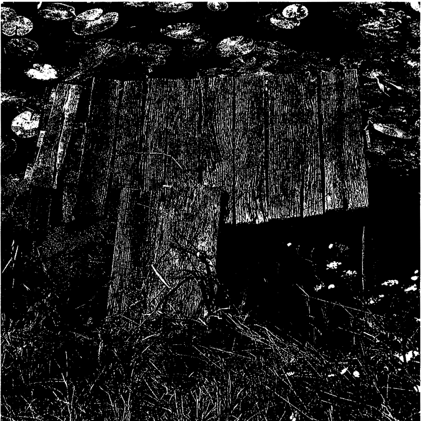
Abb. 3: Zur Ruhe kommen