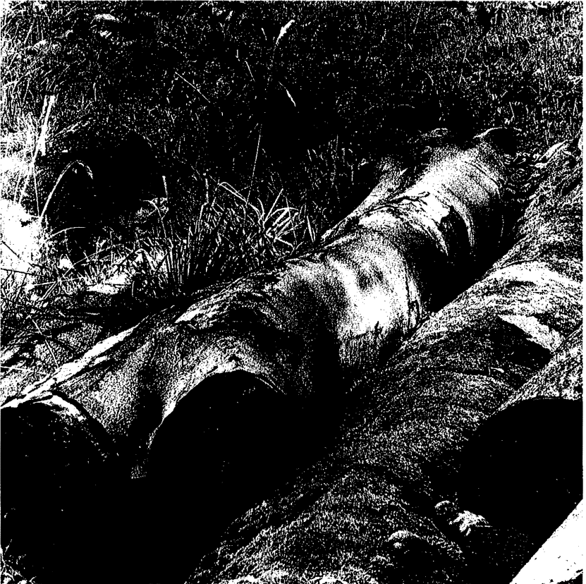
Abb. 4: Gefällt und eingebettet