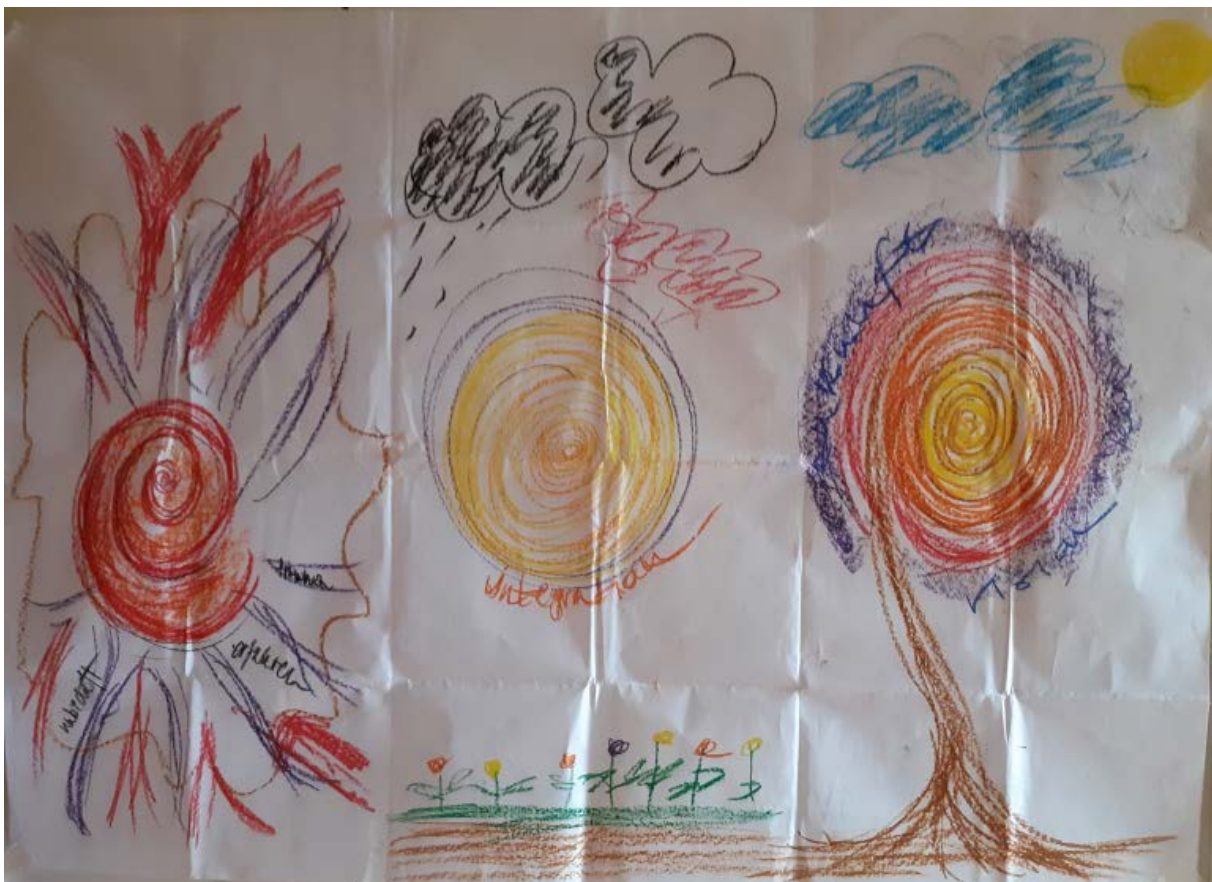
Integratives Karrierepanorama mit Fokus auf die Erfahrung in der IBPT-Ausbildung, 2. Seminar Zertifikatsstufe, Juni 2017

Ich würde dieses Bild wiederum auch als eine Art Übergangsobjekt im Sinne der IPBT (Petzold & Orth, 1995) bezeichnen. Ähnlich wie ich früher die Texte meiner Therapeutin mit mir herumgetragen hatte, hatte ich eine Zeitlang nach dem letzten Seminar das Bedürfnis, dieses Bild immer wieder zu betrachten. Es half mir, die empfundene Stärke und Klarheit mir wieder zu vergegenwärtigen, wenn sie mir abhanden zu kommen drohte. Auch diente mir das Bild als Hilfsmittel, um mir wichtigen Menschen meine Erkenntnisse und Visionen erzählen und vermitteln zu können.