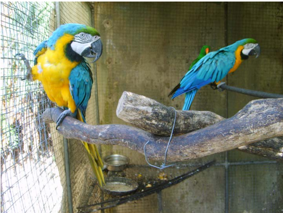
2 von 14 Ara Aurauna, Ara Macao, Ara Chloroptera u.a.m.

Der Kontext und die Anknüpfungspunkte des Konnektivierens bestimmen das Konnektivierte und seine „narrative Wahrheit“ (Petzold 1991a/2003a, 325ff). Man muss Kontexte und Kontinua verstehen, will man Menschen verstehen.