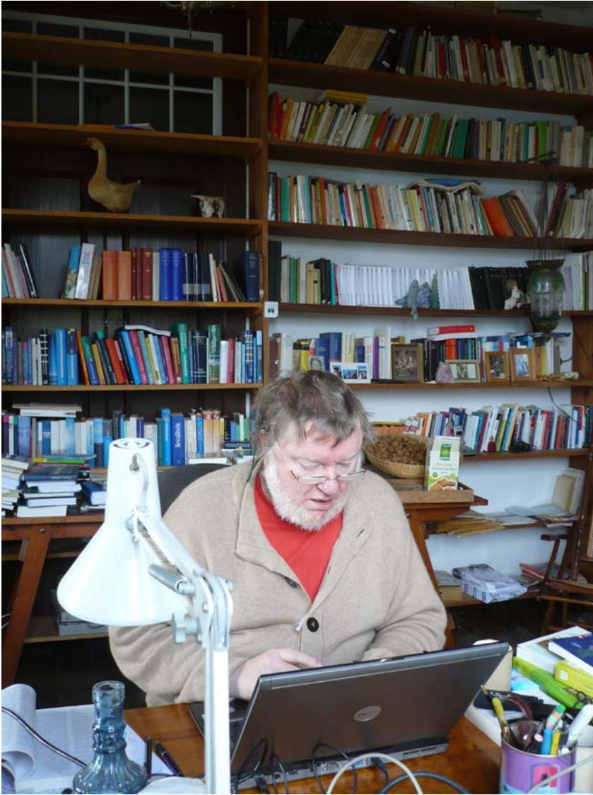
Am Arbeitstisch I