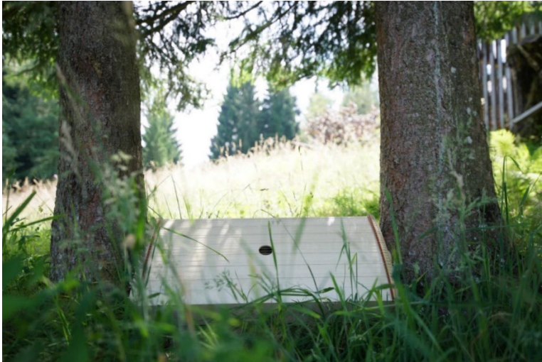
Abb. 11: Körpertambura aus der Klangwerkstatt Bernhard Deutz; Foto: Constantin Lackinger 2016.