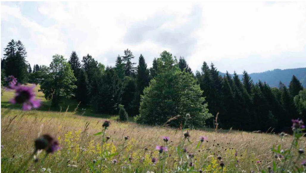
Abb. 1: Blumenwiese mit Wald im Hochsommer, Foto: Constantin Lackinger 2020.

In diesem Naturraum können alltägliche Anforderungen gut losgelassen werden. Die Wirkung dieser vertrauten und immer wieder neu bestaunten und erlebten Landschaft ist spürbar. Den Insekten und Vögeln – mitunter in der Nacht oder im Morgengrauen - kann gelauscht werden, dem Wind nachgespürt. Die Wirkung des Regens und der Sonne, oft durch Blättergrün gefiltert, wird abgemildert. Dies ist jedoch kein Ort reiner, nur ungehindert entfesselter Naturgewalten. Es ist ein behüteter, behaglicher Raum, Schutz gewährend – eine schöne, fast sanfte Form der Naturverbundenheit. Nur manchmal fährt ein Föhnsturm heftig in die nahen Bäume und rüttelt an den Häusern. Ein geliebter und vertrauter Ort des Ankommens, tiefen Durchatmens, des Auftankens und der Kreativität.