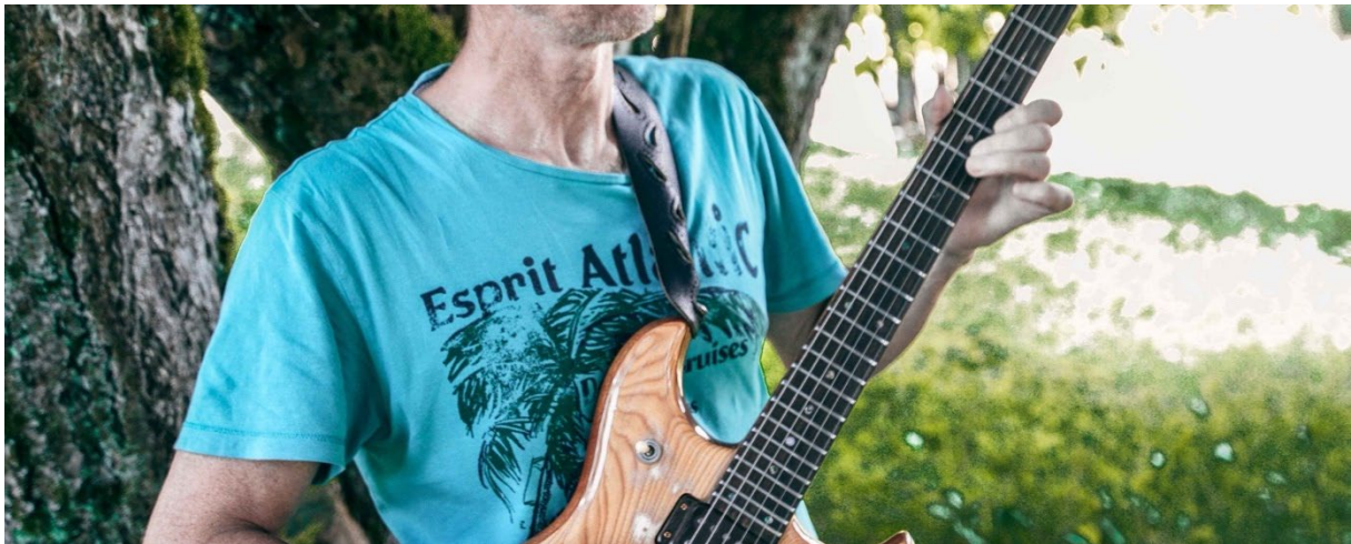
Abb. 5: K. improvisiert auf der E-Gitarre, Foto: Constantin Lackinger, 2020.

Bei E Gitarren wird grob zwischen Halb - / Vollresonanzgitarren und „Solidbodies“ unterschieden. Während erstere sich optisch und in der unverstärkten Grundlautstärke näher an den ursprünglichen akustischen Gitarrenmodellen orientieren, handelt es sich bei den Solidbodies nüchtern betrachtet um Korpusbretter bzw. -planken von 4 – 5 cm Stärke und einem angeschraubten bzw. eingeleimten Hals, welcher die Bünde (für die Intonation) und die Stimmwirbel für die Saiten trägt.