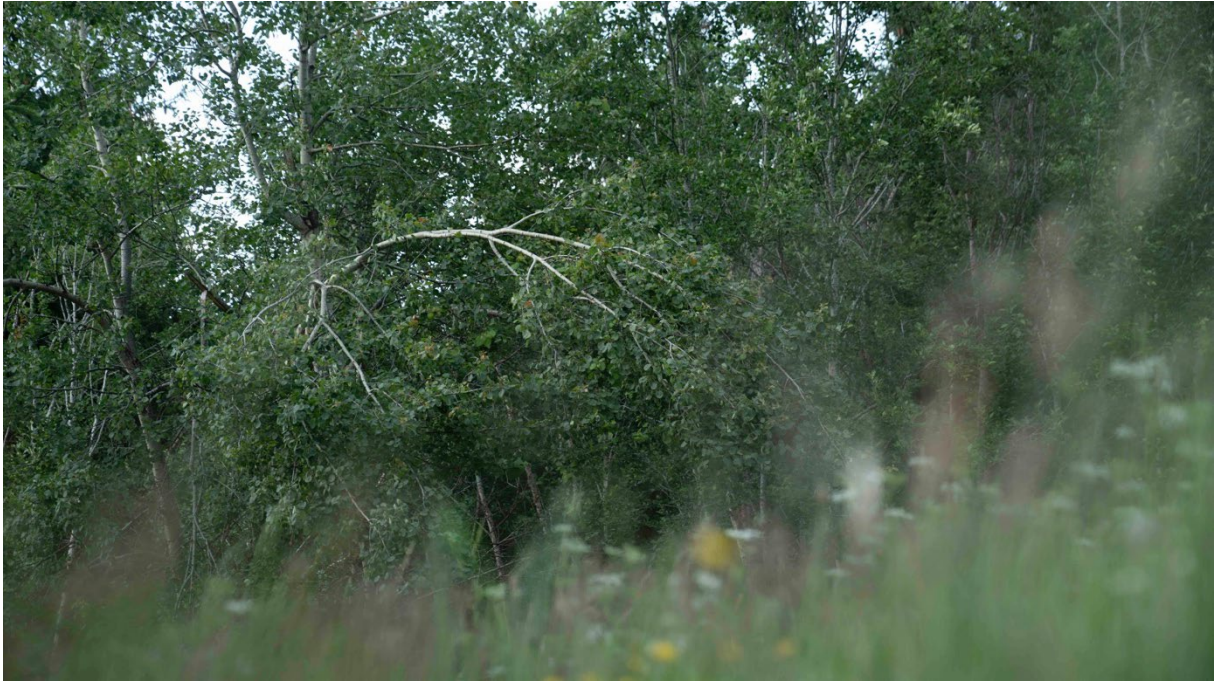
Abb 6: Der für das Resonanzspiel auf dem Cello von M. ausgewählte Baum, Foto: Constantin Lackinger, 2020.

GHP: Kannst du sagen, was du empfunden hast?