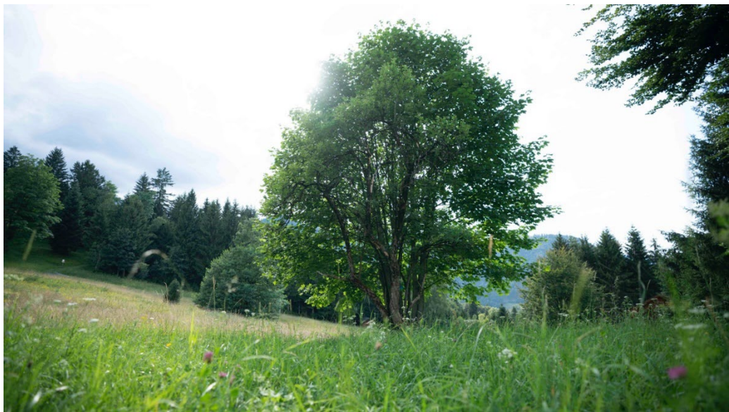
Abb.7: Baumgruppe als Ausgangspunkt für das Resonanzspiel von K., M. und R., Foto: Constantin Lackinger, 2020.

In dieser musikalischen Resonanzrunde haben drei Musiker*innen mit Blick auf die Baumgruppe, wie oben abgebildet, miteinander musiziert. Die Aufgabe war, sich in das GRÜN zu vertiefen, sich leiblich zu spüren und dann nach einem Moment der Stille ins Spielen zu finden.