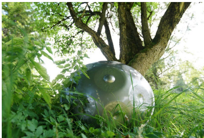
Abb 8: Handpan, exemplarisches Foto: Constantin Lackinger, 2016.

Bei der Handpan handelt es sich um ein „Blechklanginstrument, das mit den Händen gespielt wird. Das Percussions-Instrument wird auch als Pantam bezeichnet und besteht aus zwei Metallhalbschalen, die zusammengeklebt sind. Auf der Oberseite befinden sich Tonfelder und auf der Unterseite ein Resonanzloch. Beim Anschlagen der Tonfelder mit den Fingern ertönt ein sphärischer Klang. Die Form des Musikinstruments ist an das Hang® aus der Schweiz angelehnt. Die Tonarten der Handpan können variieren. Auch gibt es Modelle mit unterschiedlichen Frequenzen. Wir haben ein Instrument mit einem tieferen Kammerton verwendet und zwar in der Stimmung Cis-Moll. Das nachstehende Foto ist ein Symbolfoto und zeigt nicht das im Projekt verwendete Instrument (vgl. Handpan-Portal, online).