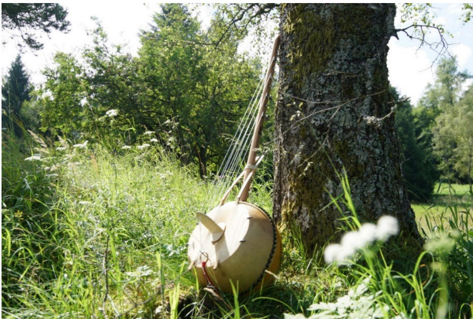
Abb. 4: Doussn’Goni, Foto: Constantin Lackinger 2020.

Doussn’Goni ist eine afrikanische Harfe, die von der Schweizer Firma Twice Percussion nach traditionellem Fertigungshandwerk hergestellt und wie folgt beschrieben ist: „Die westafrikanische Jägerharfe ist in unserer Ausführung mittels Violawirbeln einfach stimmbar. Eine mit Ziegen- oder Hirschfell bespannte Kalebasse bildet den Resonanzkörper, auf dem die Darm- oder Carbonsaiten über einen Steg in zwei Reihen angeordnet sind. Die Grundstimmung sollte wegen der Saitenspannung nicht mehr als einen Ganzton über oder unter der angegebenen Stimmung variiert werden“ (Twice Percussion, online).