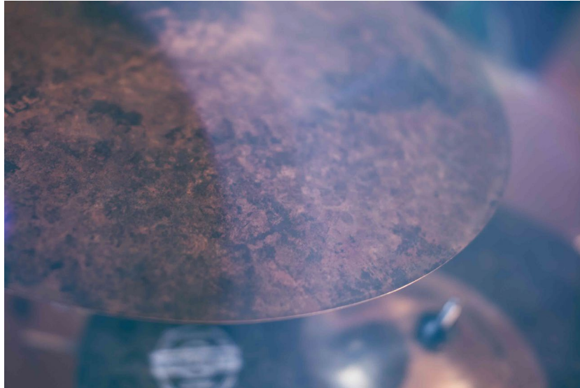
Abb 9: Becken, dunkel, Bronzelegierung für einen dunklen, erdigen Klang; Foto: Constantin Lackinger, 2016.

sie mit weichen Schlägeln sanft gespielt werden, für die Resonanzarbeit rezeptiv genutzt werden (vgl. Petzold 1987b/2017, Petzold 1989c).