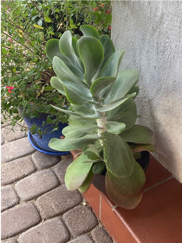
Abb.11: Sukkulente, liebevoll „Elefantenohr“ genannt, Foto: Gunhild Häusle-Paulmichl 2022.

Nach dem Betrachten der Pflanze setzte sich der Musiker CS ans Clavichord, das er, wie er im letzten Gespräch noch erwähnte, 1997 von Koen Vermeij in Bennebrock in den Niederlanden bauen ließ. Das Instrument trägt die Nummer 43. Im Anschluss spielte CS das Resonanzspiel auf das Betrachten der Pflanze am Clavichord am 26.8.2022, welches wiederum in mir folgende Resonanz erzeugte: