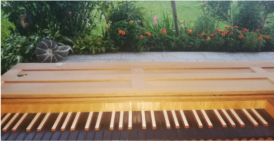
Abb.10: Clavichord. Blick aus Spielerperspektive; Foto: CS (Musikpädagogin).

versuchen zu tanzen. Auch die Rüssellaute der Elefanten konnte ich mir vorstellen. Die Musik hinterlässt Freude und Spaß“ – soweit die Resonanz der Zuhörerin.